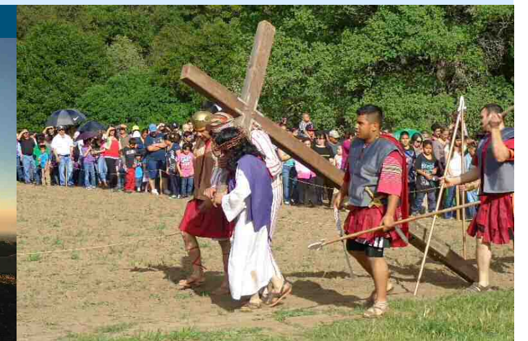
Viernes Santo 2013