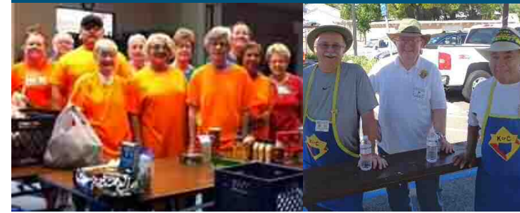
Caballeros de Colon